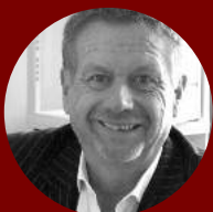
Ulrich Bülow ZDF Hauptstadtstudio